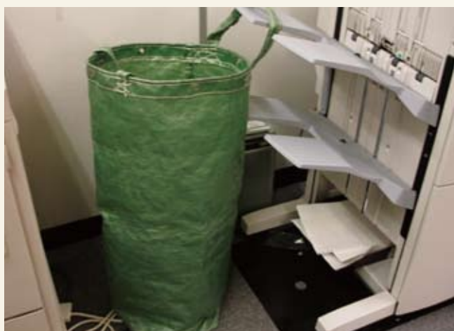
辦公室內放置了廢紙收集袋以支持回收再造。