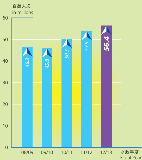
香港國際機場過往五年客運量 Five-Year Passenger Traffic at HKIA